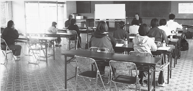
▲去年の講習会の様子

また、適格請求書等保存方式(いわゆるインボイス制度)も平成35年10月より始まり、適格請求書の保存が仕入税額控除の要件となり適格請求書は発行事業者への登録が必要となったり、課税事業者から適格請求書の発行を求められた場合は交付・写しの保存が義務化されたりなど、課税事業者・免税事業者問わず様々な対応が必要となります。前もっての準備が必要となりますので、是非講習会にご参加頂ければと思います。