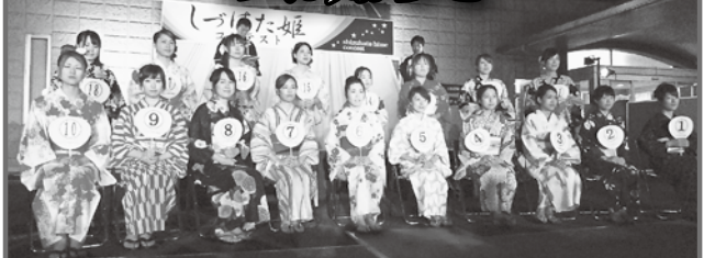
昨年のしづはた姫コンテストの様子

今回も様々な企業・団体の皆様により、多大なる協賛を頂きお陰様で、今年も当コンテストを開催できる運びとなりました。優勝の方には、11月3日開催の「薬師まつり」において第39代「北の方(幼名しづはた姫)」を演じて頂く事となります。