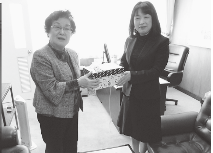
▲築館桜祭りでのつき男・つき女決定戦の様子(上)、 瀬峰桜祭りの様子(左下)、女性部愛の鈴贈呈の様子(右下)