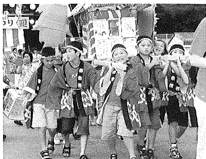
ワッショイ! ワッショイ!

「広場」では奥州高清水桂太鼓頭彰会による太鼓演奏、姫っこおどり愛好会や、栗駒GOZAI in踊り子隊、ザ・金成舞姫、よさこい高清水連等各種参加団体によるよさこい踊りが披露され、女性部を中心とする各種婦人団体の手踊りは、見物の方も加わり、「かつらっぱ音頭」、「栗原音頭」、「高清水音頭」の曲にあわせて大きな輪ができました。 祭りのフィナーレは「桂葉清水前特設会場」にてミニ花火大会!! 夏の夜空を彩る花火大会は高清水の皆さんの協力で、ミニではありますが大花火となり、見物客の歓声がこだましました。