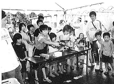
狙いをつけた先は…

当日はあいにく雨天のため開催が危ぶまれましたが開催が決まると天候も徐々に良好となり、「わいわいチビツ子広場」では射的