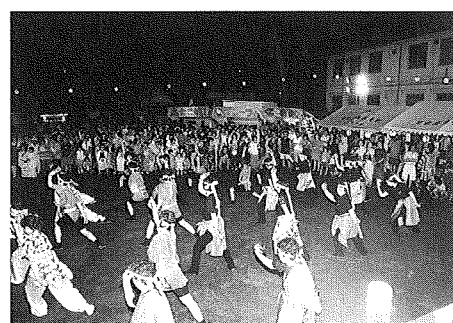
4団体競演したよさこい踊り

会やカッパのエアトランポリン、わたあめ、ポップコーン、風船無料配布などたくさんイベントが開催され、多くの子供連れの家族で賑わいました。 また、夕方「まつり広場」では露天商や青年部による屋台が出店され、「やぐら