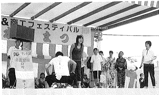
何を叫んでいるのでしょうか？

その中でも、今年初登場の「大声大会」が盛り上がり老若男女問わず大勢の人が参加し、「お金が欲しい」「ゲームばかりしてんじやねーよ！」「長生きするぞー」と自分で考えた言葉を発しながら競い合い、終了後には参加者全員日頃のストレスを発散していました。