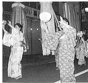
女性部も参加しました。