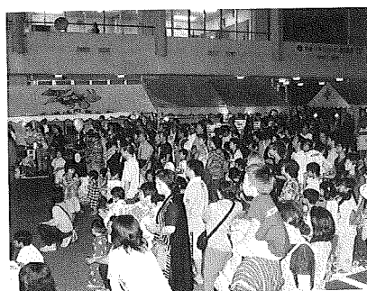
抽選番号を照らし合わせる観客

ていました。また、会場では地元団体による神楽、空手・太鼓の演舞等が観客を魅了し、我が子の勇姿をカメラにビデオに収めようとするとする親の姿が多く見受けられました。日も暮れる頃には、盆踊りの音楽が高らかに流れ、