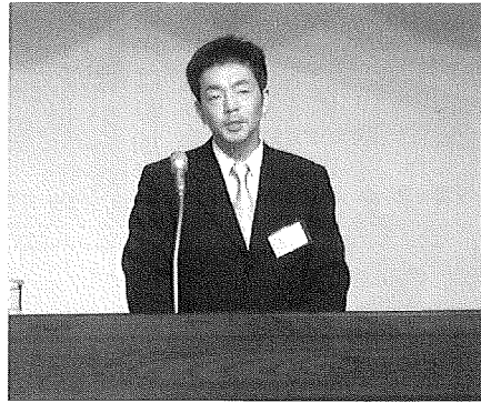
熱弁を振るう武田氏

れた東北六県・北海道ブロック主張大会に宮城県代表として出場し、見事敢闘賞を受賞しました。