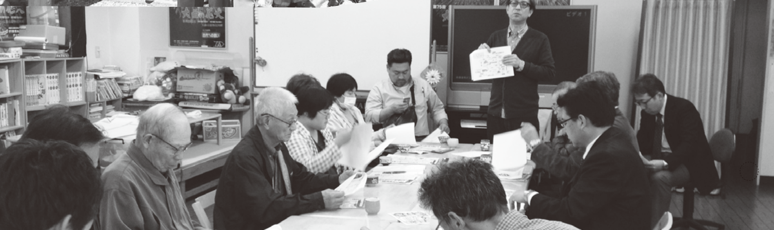
▲写真上：工業部会視察研修 於酒田市