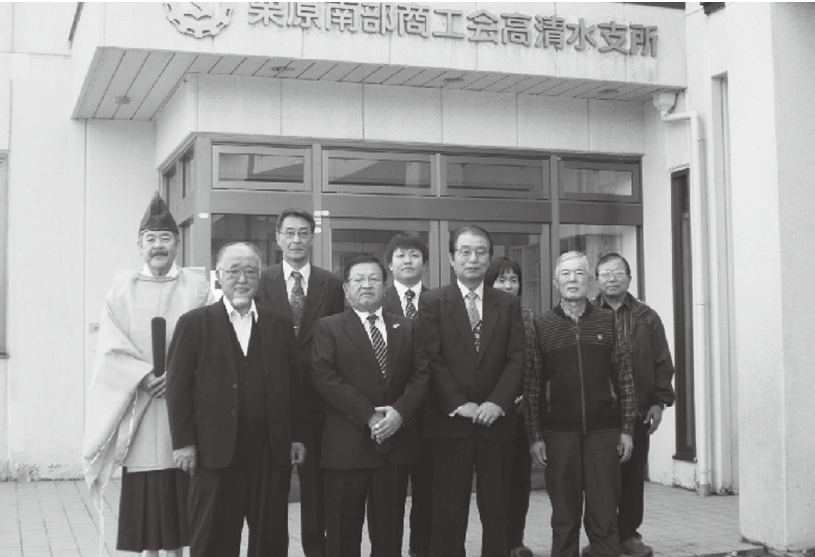
▲高清水支所会館の修繕が完了しました。