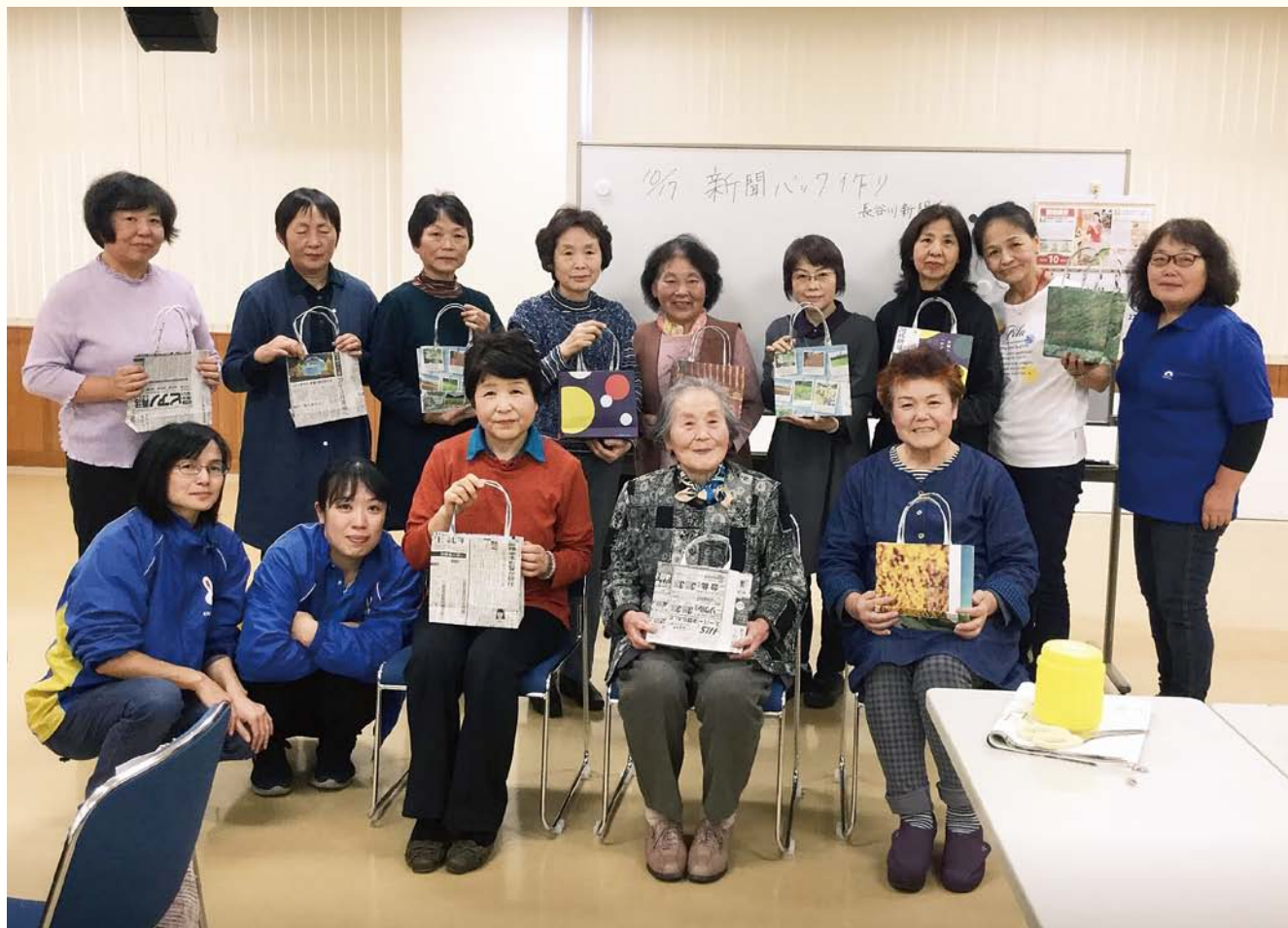
▲まちのたからばこ プログラムの様子

発行者 会長 阿部 忠雄 編集 栗原南部商工会情報委員会 印刷所 南部屋印刷株式会社