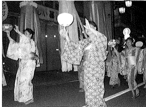
つきだて七夕まつり 8月5日、6日：築館地区商店街