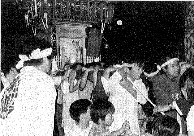
せみね夏祭り 8月14日：公民館前広場

発行所 栗原南部商工会 〒987-2252 栗原市築館薬師四丁目2-27 TEL : 0228(22)3611 FAX : 0228(22)3612 発行者 渡 邊 一 正 編 集 栗原南部商工会情報委員会