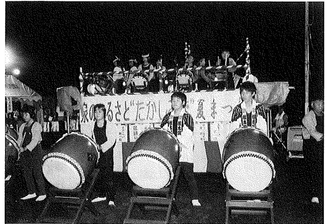
泉のふるさと“たかしみず”夏まつり 8月15日：高清水総合支所駐車場