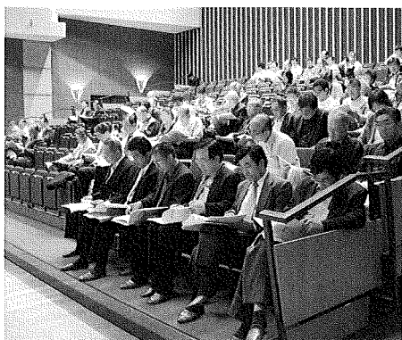
総代会会場の様子