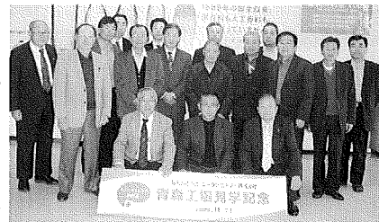
▲みちのくコココーラ青森工場にて

機などの最 新設備を導 入しており ますが、山 菜や野菜な ど一つ一つ 形の違う仕 入れ原料を 扱うため手 作業の工程 も他の工場 に比べ多くあります。そのため、パ ートを含めた従業員が二百名超従事 しており、地元の雇用にも貢献して いる企業でした。