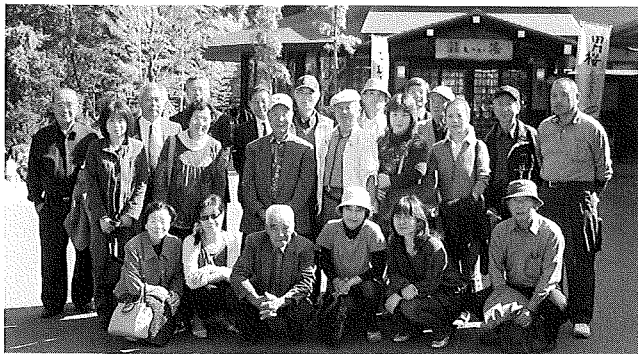
▲天然温泉いい湯前にて

で昼食をとり、「天然温泉いい湯」で入浴休憩しました。参加した部会員の皆様は、いいところをききましたと言っていました。今度の商業部会視察研修会には、もっと多くの方が参加下さいますようお願いいたします。